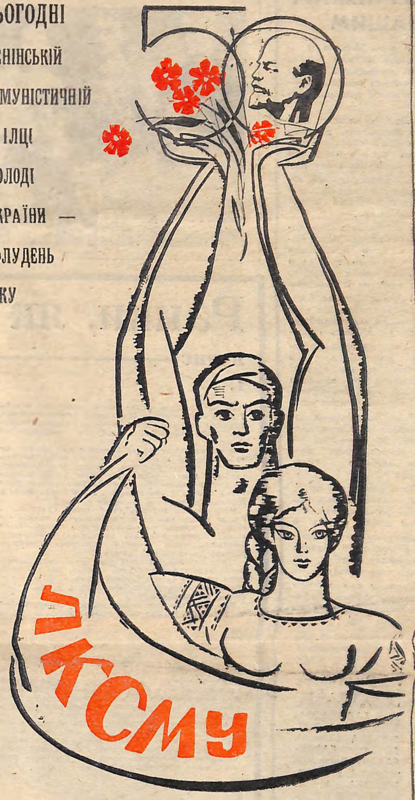
Малюнок В. ОСТАПЕНКА.

СЬОГОДНІ ЛЕНІНСЬКІЙ КОМУНІСТИЧНІЙ СПІЛЦІ МОЛОДІ УКРАЇНИ — ПОЛУДЕНЬ ВІКУ