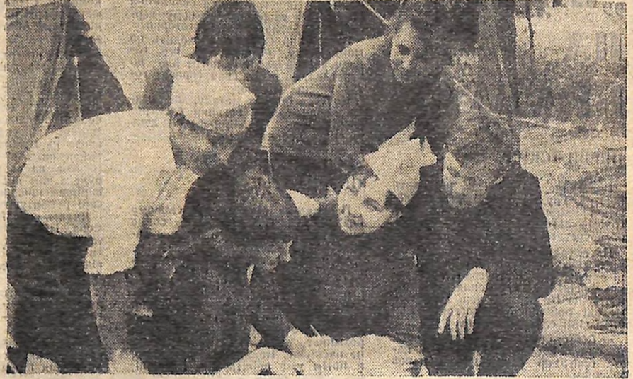
Полтавчани в Кіровограді відкрили восьмий п'ятитурнір туристів-краєзнавців. Старим і новим туристам, комсомольським активістам, педагогам екскурсійної загони репортували про свою діяльність протягом минулого навчального року.

В перший день збору було проведено огляд-конкурс на кращий похідний блудні, кращий дев'ять екскурсійної загони. Юні туристи Світловодська, Знам'янки, Олександрії, Новоукраїнки, представники інших районів області показали учасникам зльоту, членам журі свої матеріали, які вони збирали під час туристських мандрівок.