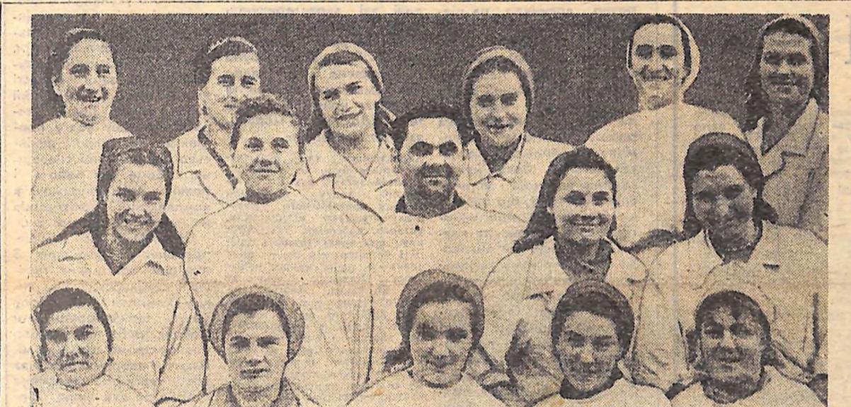
Комсомольсько-молодіжний колектив імені 50-річчя ВЛКСМ молочно-товарної ферми колгоспу «Мир» Гайворонського району знову серед кращих збіжжів області. За високі показники в соціалістичному змаганні, присвяченому піввіковому ювілею комсомолу України, гайворонцям вручено пам'ятний вимпел ЦК ЛКСМУ.

Учасники зборів з великим піднесенням прийняли тексти вітальних листів Центральному Комітетові КПРС і Центральному Комітетові КП України.