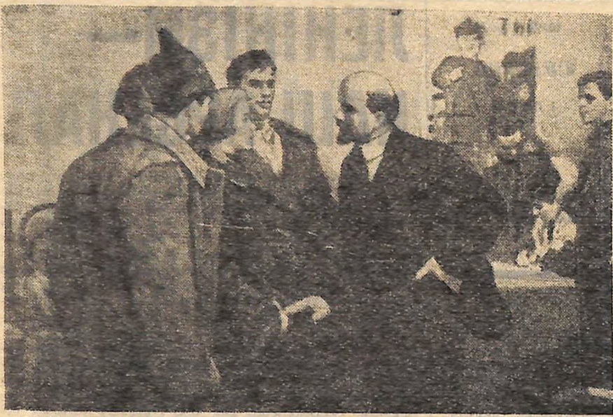
«РОЗМОВА З ПІДЛЕЧЕМ».