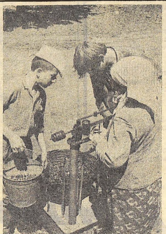
Як тільки учні Первозаванівської середньої школи Кіровоградського району склали останній іспит, одразу поспішили на допомогу своїм батькам. Нині вони щодня господарюють в саду місцевого колгоспу імені Шевченка, збирають урожай черешні, вишні, яблук.

І. ШМЕЛЬОВ, доцент, завідувач кафедри економіки і організації виробництва Кіровоградського інституту сільськогосподарського машинобудування.