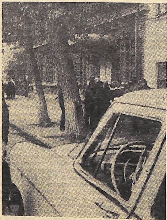
Біля середньої школи № 1 в Ульянівську, де навчався Володя Ульянівський.