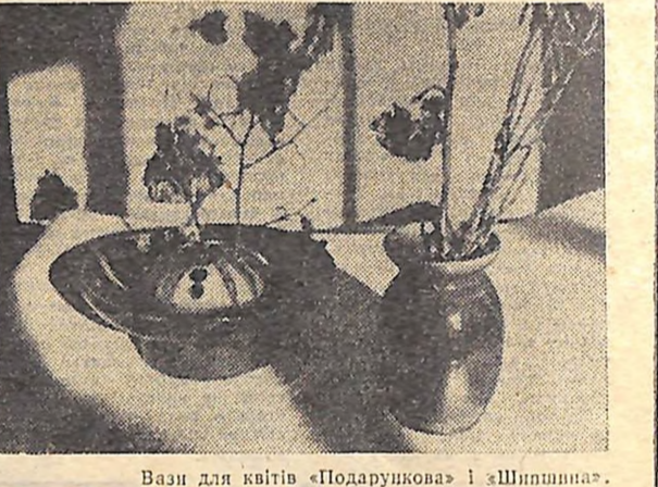
Вазн для квітів «Подарункова» і «Шпіншва».