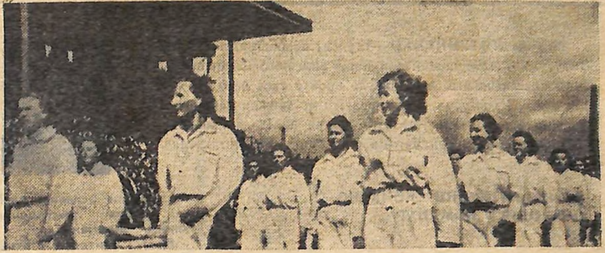
Молодість нової Польщі.

Протокол про взаємні поставки і платежі на 1969 рік передбачає зростання товарообороту між двома країнами на 18 процентів. (Кор. ТАРС).