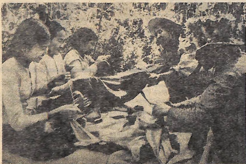
Все для перемоги. Жінки шють уніформу. («Фрайс вельт»).