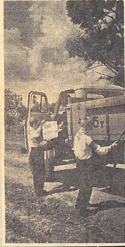
На рукавах хлопчиків (фото вище) — червоні пов'язки. На них чотири літери — «ЮДПД». Це юні пожежники Ладжамської середньої школи. Що вони роблять? Перевіряють кожну машину, яка їде в степ: чи в іскрогаски, пожежне відро, лопата, брезент. А це вони дуже прискількиво перевіряють, чи піде не спалиться зерно з кузола.