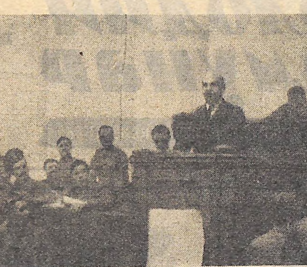
В. І. Ленін

від Р. Р. Д. було б кроком назад, — а республіка Рад робітничих, батрацьких і селянських депутатів по всій країні, знизу доверху». — проголосив Ленін. (В. І. Ленін. Твори, т. 24, стор. 5). Ленін, викривляючи опортуністів, довів, що життя виступило в порівнянні з парламентарною республікою новий «вищий тип демократичної держави» і таким чином республіка Рад. Це було видатне відкриття творчого марксизму. Воно мало історичне значення для забезпечення перемоги соціалістичної революції і в жовтні 1917 року, встановлення Радянської влади і побудови со-