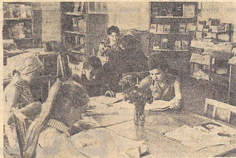
...Ну, а книга — то світ незвичайний — У однім ескадроні з Корчагіним Весельковим вогнем зорі, Пролітають за обрій мрії!

У футболістів теж гаряча пора. Секретар комсомольської організації, він же громадський тренер, Ва-