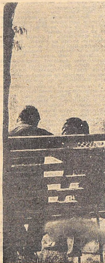
...Ти привидься мені перебіваю У житах в молодому полі, Ти насиня мені соплікою Там, де шляхом ідути толоді.