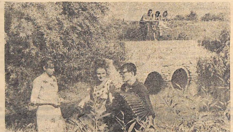
...А коли в надвечір'я повне З-понад ставу покотить місяць.