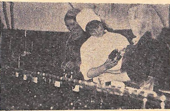
Олександрівський район.

секретар комітету комсомолу Цибульського консервно-сушального заводу.