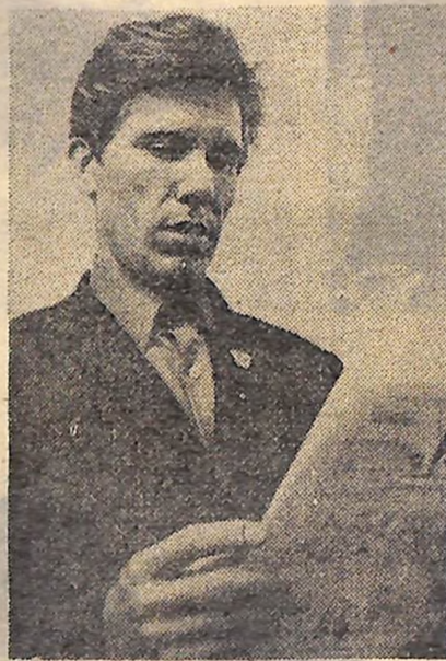
ШТРИХИ ДО ПОРТРЕТА ТВОГО СУЧАСНИКА

На фестивалі прийшли 55 представників естрадного мистецтва з 26 країн. Вони виконають сто пісень. Від Радянського Союзу в конкурс беруть участь Муслім Магомедов. Учасники фестивалю і глядачі тепло вітали почесного гостя Леоніда Утьосова.