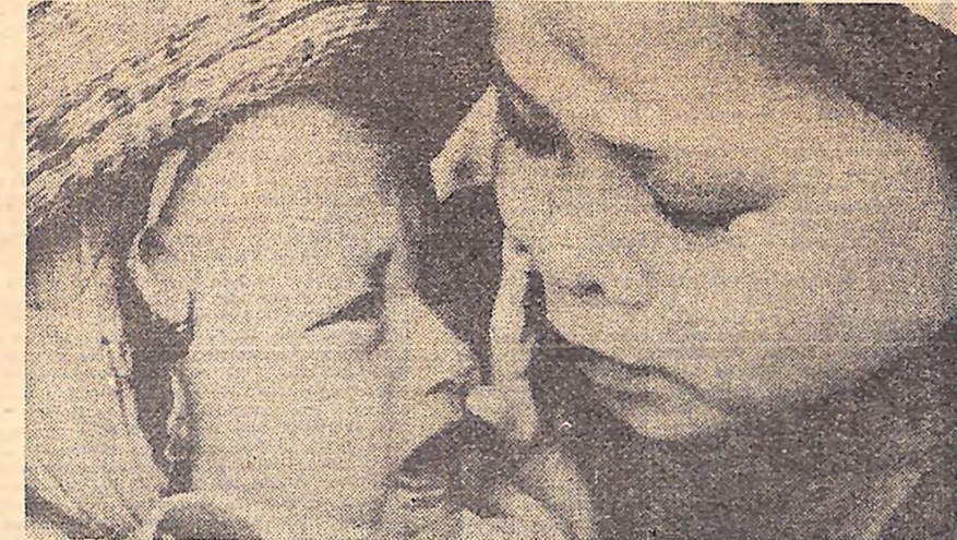
В'єтнам. Бомби над Бен Тей.

В НДР відпочивають діти батьків, які потерпіли від ізраїльських інтервенцій.