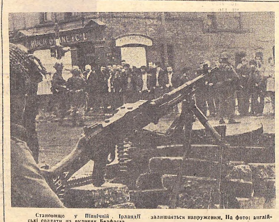
Сталовице у Північній Ірландії залишається напруженим. На фото: англійські солдати на вулицях Белфаста.

рівними, постійно відкидає назади громадянських прав та економічних можливостей для своїх чорних громадян. Нація, народжена революцією, використовує зараз свою величезну потужність для придушення народу, що повстав за всім іншим Милд від її беріг.