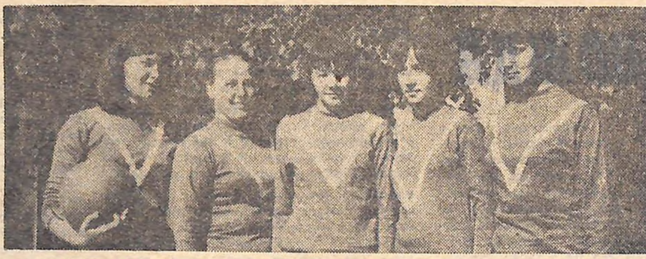
Серед чемпіонів — п'ятірка баскетболісток.