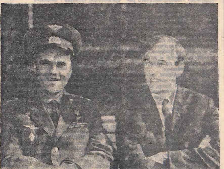
Екіпаж «Союз-8»: космонавти В. О. ШАТАЛОВ і О. С. ЕЛІССЕВ.

18 жовтня 1969 року о 12 годині 10 хвилин московського часу після виконання програми космічний корабель «Союз-8», пілотований командиром групи кораблів Героєм Радянського Союзу, льотчиком-космонавтом СРСР, полковником Шаталовим Володимиром Олександровичем і борт-інженером Героєм Радянського Союзу, льотчиком-космонавтом СРСР, кандидатом технічних наук Еліссєвим Олексієм Станіславовичем, приземлився в заданому районі території Радянського Союзу за 145 кілометрів на північ від міста Караганда. На Землі космонавтів тепло зустріли представники групи пошуку, спортивні комісари, друзі і журналісти. Стан здоров'я космонавтів добрий, самопочуття прекрасне. Груповий політ трьох радянських космічних кораблів «Союз-6», «Союз-7» і «Союз-8» завершено.