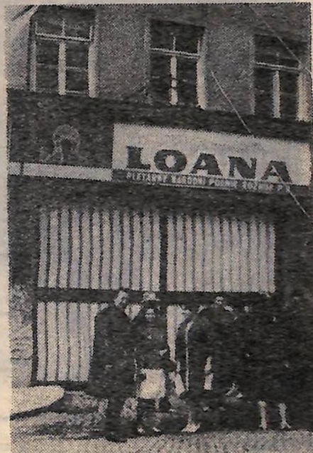
Група туристів Кіровоградщини сфотографувалася на згадку біля трикошарного комбінату «Лоана».