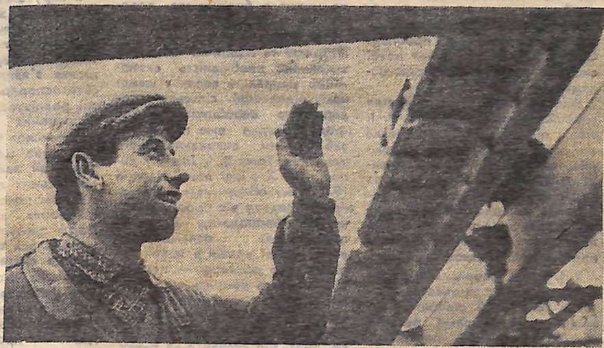
Світловодськ — місто молоде, але про нього знає вся країна. Стату таку місто на Дніпрі завоювало багатьма підприємствами і, зокрема, продукцією заводу залізобетонних конструкцій і виробів.