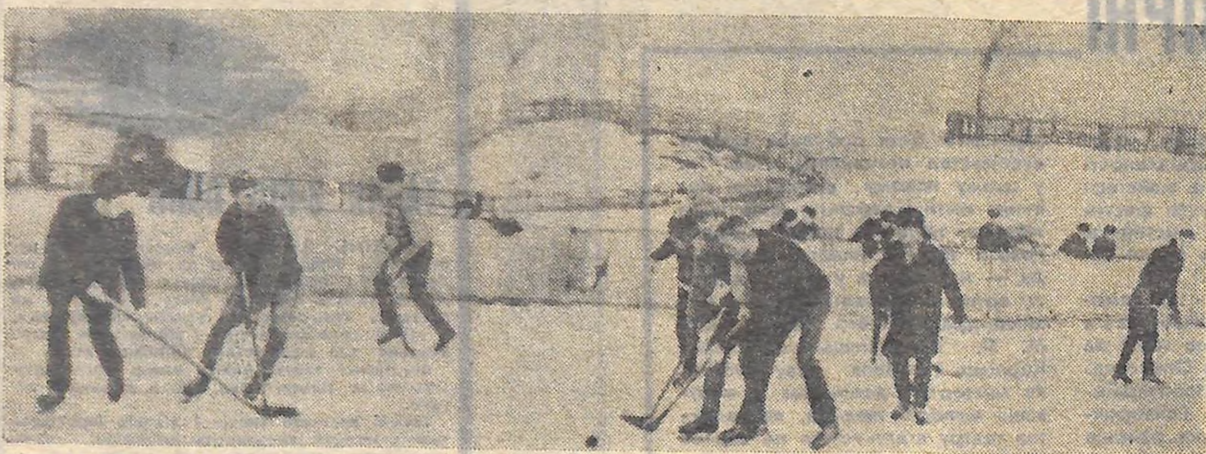
На лід вибігли юні хокеїсти.