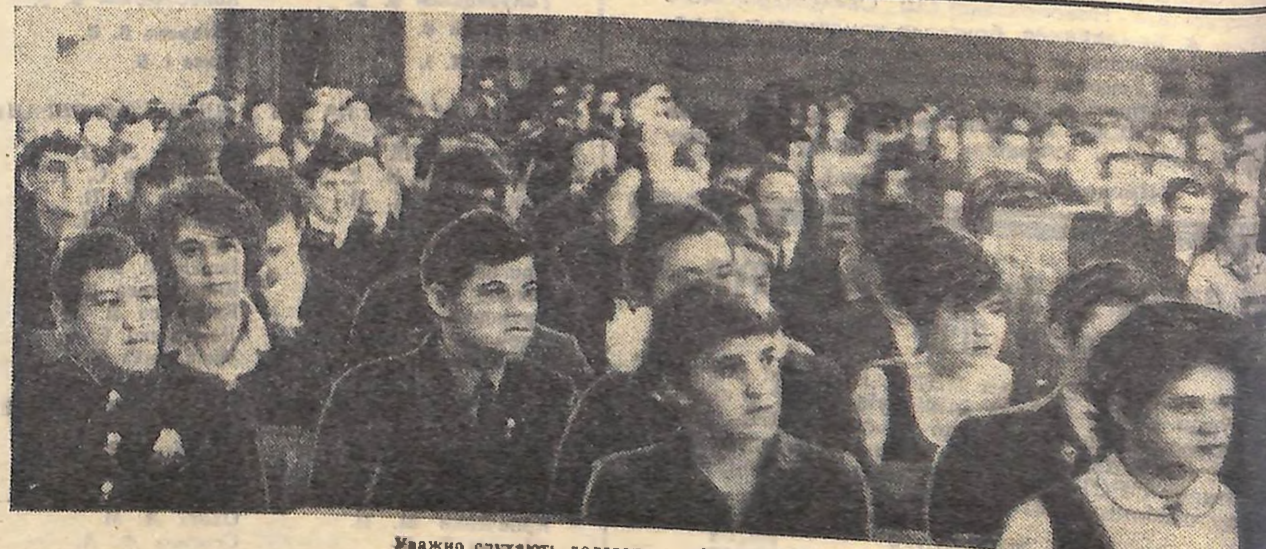
Важко слухають делегати конференції виступаючих.