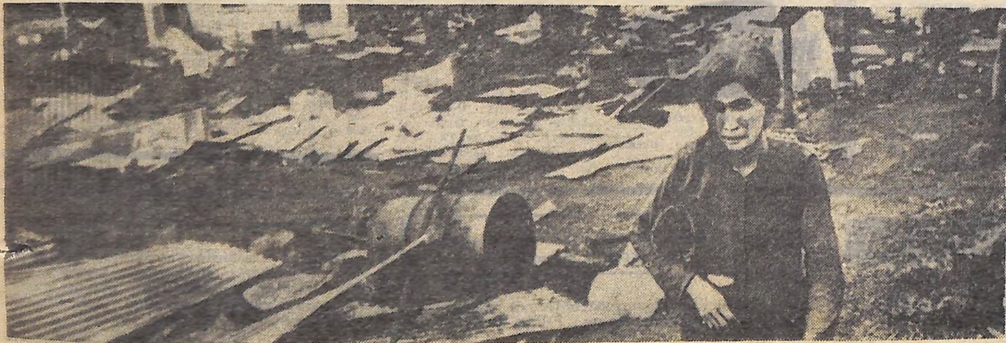
Шостий рік продовжується агресія США у В'єтнамі, яка забрала тисячі молодих життів і зруйнувала сотні міст і сіл.