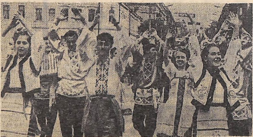
У святкових колонах — кіровоградці.

Редакція шде свої вітання і подяку всім, хто брав участь у творенні друкованого комсомольського органу.