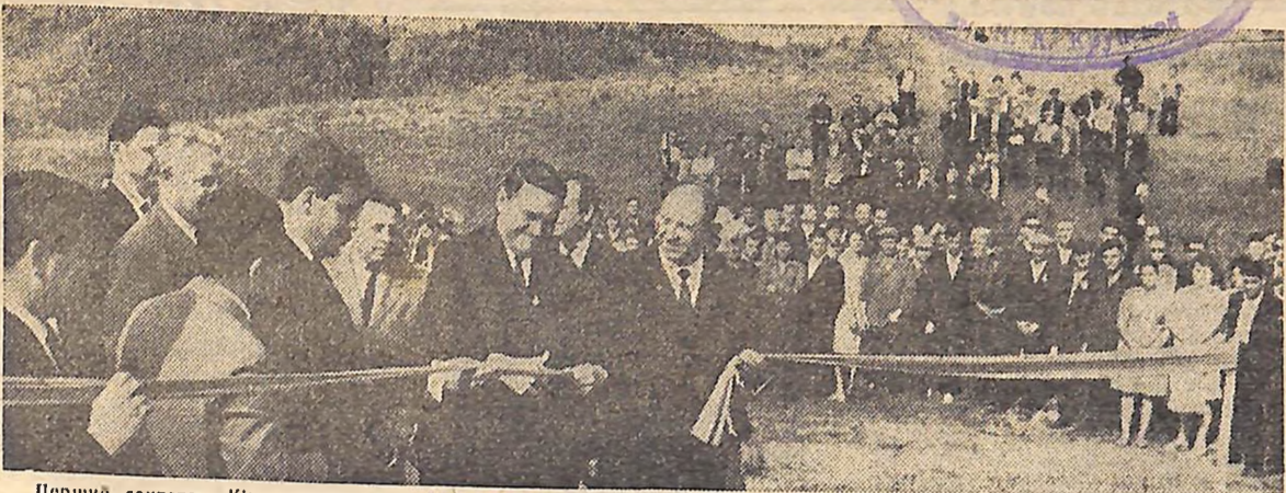
Перший секретар Кіровоградського обкому КП України М. М. КОБИЛЬЧАК перерізає стрічку.