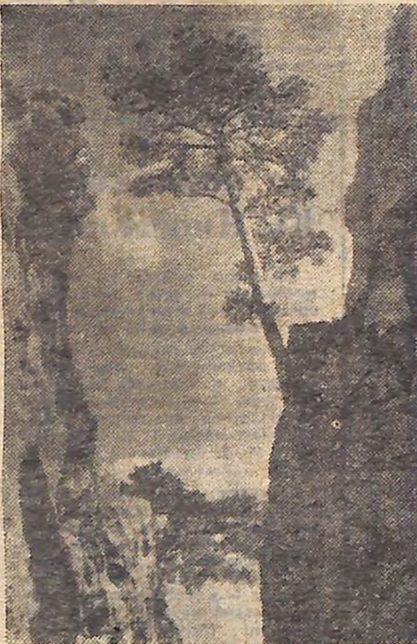
Ай-Петрі. Дивинися — думаш. Життя торжествує всюди. На прямовисній стіні уриває на диво міцно тримається дерево, і ніпочім йому верховинні вітри та бурі (на фото вгорі). Справа — репер (спеціальний знак на позначення висоти над рівнем мо- ря) на вершині гори.

Величезна природна тріщина землі довжиною біля трьох кілометрів, глибиною 380 метрів і найменшою шириною по дну 3—4 метри, яка зна- ходиться десь за Ай-Петриським платом на північних схилах, давно вже манила і кликала нас. Очевидці розповідали про неповторну красу великого каньйону Криму.