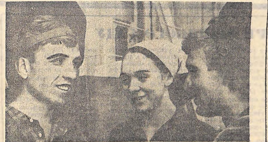
Для багатьох енергобудов країни такі залізобетонні конструкції як вежі, ванни, різні види колонн виготовляються на Світловодському заводі виробничого об'єднання «Дніпроенергобудіндустрія». На всіх ділянках тут з ентузіазмом трудяться комсомольці.

Стара система навчання і виховання, була падкована від буржуазного суспільства, була непридатна для підготовки будівників комунізму. Ленін поставив завдання не тільки зміняти зміст навчання молоді, але й весь характер освіти. Він говорив, що не можна відірвати навчання, виховання і освіти від життя, від боротьби, від праці. Він підкреслив, що радянська школа повинна давати молоді не тільки основи знань, але й озброювати вмінь.