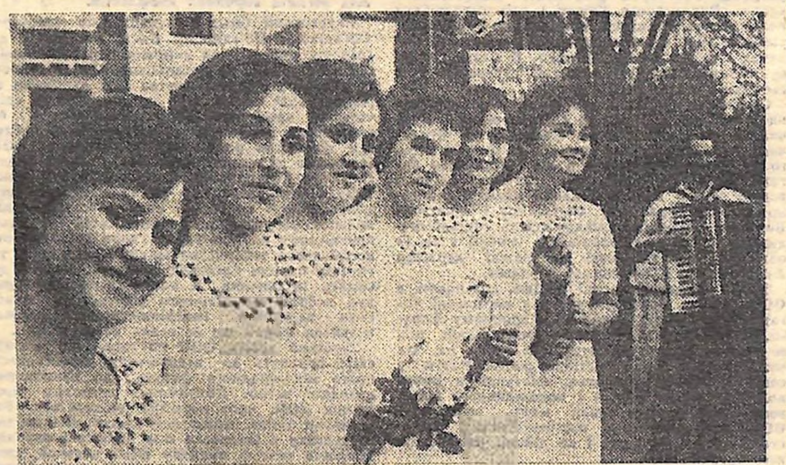
З веселих, голосистих дівчат складається вокальний ансамбль Новоархангельського району ого Будинку культури.

Стенограма лекції, прочитаної професором кафедри історії КПРС Білоруського державного університету Журован А. Е. на республіканському семінарі молодих лекторів 6 липня 1970 року в місті Ташкенті, подана із значними скороченнями.