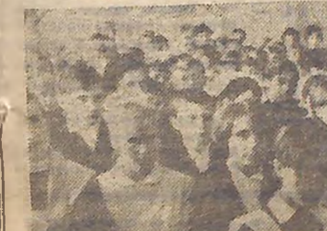
В залі конференції.