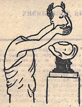
Що робить з людиною слава.