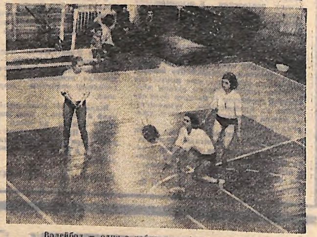
Волейбол — один з найпопулярніших видів спорту в Кіровоградському машинобудівному технікумі. Тут тріпають регулярно змагання між групами, курсами. Волейболісти технікуму учасники змагань міського та обласного масштабу. На знімку: волейболісти на тренуванні в залі СК «Зірка».

Рекорди світу 1980 року — 47,6 — 47,8; СТРИБКИ У ВИСОТУ — 2,33 — 2,35; З ЖЕРДИНОЮ — 5,75 — 5,78; В ДОВЖИННУ — 8,90; ПОТРІЯННИЙ — 17,50 — 17,60; ШТОВХАННЯ ЯДРА — 22,40 — 22,60; МЕТАННЯ ДИСКА — 73,0 — 74,0; МОЛОТА — 79,0 — 80,0; СПНСА — 89,0 — 89,0.