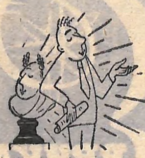
Епігон: будьте певні, що це світло випромінюю Я.

Пропонуємо читачам кілька малюнків Б. Куманського з серії «А ГЕНІЯМ, ДУМАЄТЕ, ЛЕГКО!»