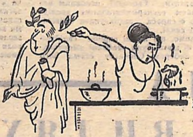
Геній у себе вдома.