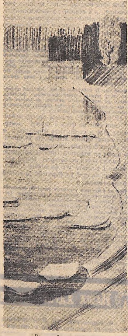
Весняний льодохід Малюнок І. КРИВОРОГА.

В тобі немає доброти — Живеш тоді навздогід? Крізь тошну світу прорости Лиш їй судилося ніщо. Від доброти і серця і рук Палю духмяний стіс. Від доброти дужіє руш І солоний піс. Сміється сонце в глибині, Тендітний злак ласкавить. І день при дні, і день при дні Добро на світі править. Поги дихим не змогли, Воно від сильних дужче, Від доброти, від теплоти Усе на світі суше.