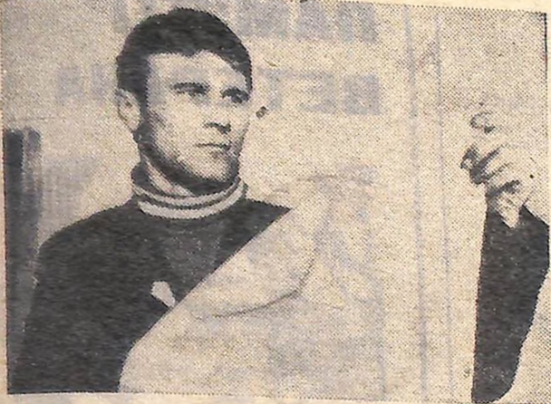
ДО ПОРТРЕТА МОЛОДОГО ХЛІБОРОБА