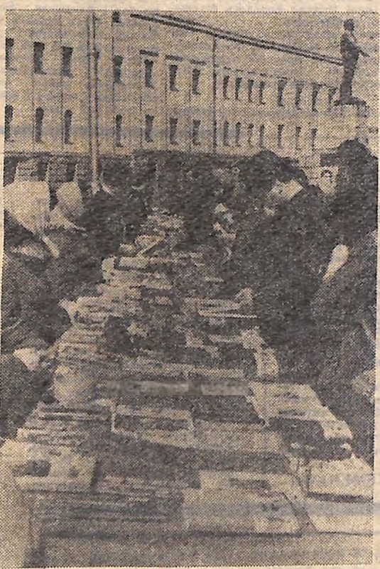
В Кіровограді триває місячний книж. Разом з культурними в нього включилися і працівники приладу. Вони влаштовують книжкові базари, запрошують в магазини літературі.