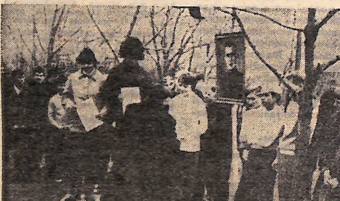
На знімку: переможці легкоатлетичного кросу в Бобринці на приз Василя Лорика.

СПОРТ СПОРТ СПОРТ СПОРТ СПОРТ СПОРТ СПОРТ СПОРТ