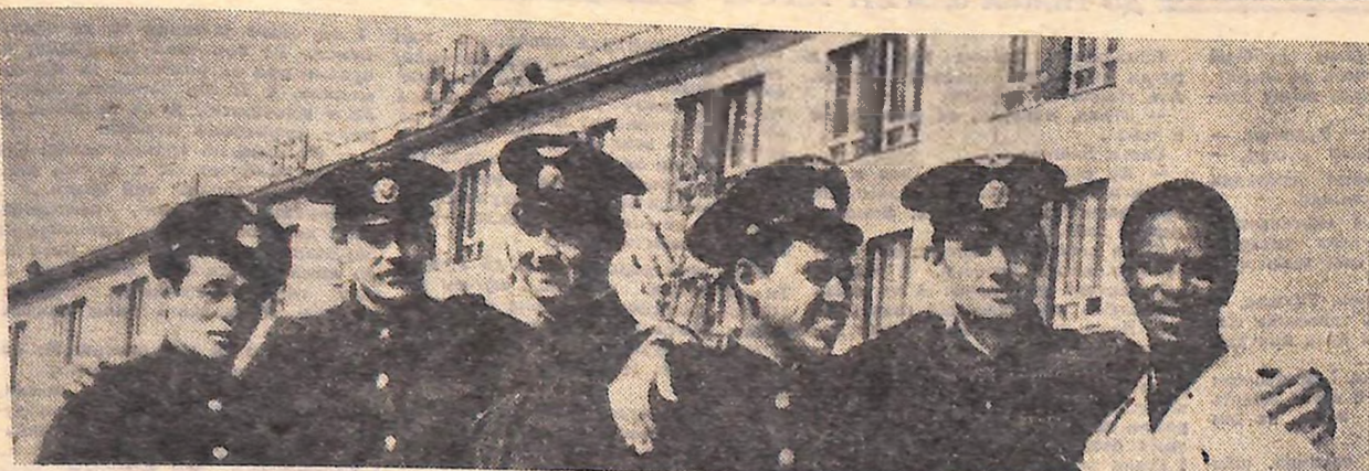
В Кіровоградській школі вищої льотної підготовки цивільної авіації разом з радянськими юнаками навчається молодь з багатьох дружніх країн.