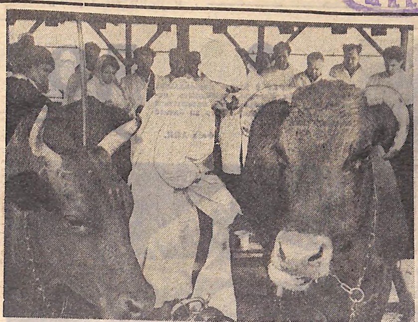
Змагання за титул чемпіона.