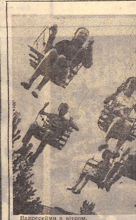
Наперейми з вітром.

ПОКАЗУЄ КІРОВОГРАД СУБОТА, 26 червня. ПЕРША ПРОГРАМА. 9.05 — Гімнастика для всіх. (М). 9.30 — Новини. (М). 9.45 — Кольорове теле- бачення. Для дітей. «Грай- теся з нами». (М). 10.15 — Науково-популярна про- грама «Здоров'я». (М). 10.45 — «Музичний турнір». Виступають колек- тиви художньої само- діяльності київського за- воду «Арсенал» і хімком- бінату м. Руставі. 11.45 — Прогресивні художники Японії. (М). 12.15 — «Пра- цею звеличені». (Ужгоро- род). 12.30 — Спектакль Московського драмтеатру ім. Маяковського. (М). 13.30 — Народний телес- університет. (М). 16.05 — «Народні таланти». (Уж- город). 16.35 — Прем'єра художнього телефільму «Чотири танкісти і соба- на». (Польща). (М). 17.35 — На меридіанах України. (М). 18.05 — Кольорове телебачення. «У світі товариш». (М). 19.00 — «КВН-71». (М). 21.15 — Програма «Час». (М). 21.45 — Художній фільм «На- ров розповідає». (М). 23.00 — Кольорове телебачен- ня. Концерт. (М). 23.30 — Чемпіонат Європи з важкої атлетики. (Болгарія).