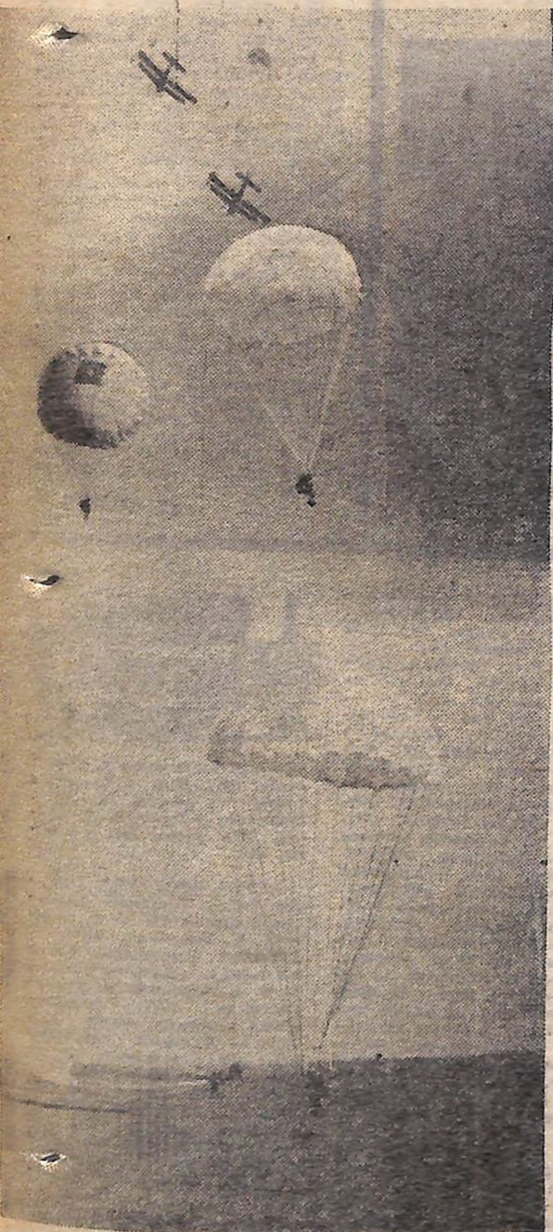
Під час воєнізованої гри був висаджений повітряний десант.