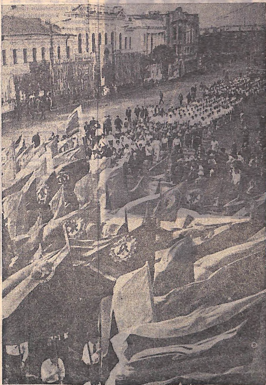
Кіровоград, площа Кірова. Урочистим маршем проходять делегати III обласного зльоту учасників походу «Шляхами слави батьків». Вгорі праворуч — доставка гірлянди квітів на бронетранспортері.

У КІРОВОГРАДІ ЗАКІНЧИВСЯ ОБЛАСНИЙ ЗЛІТ УЧАСНИКІВ ПОХОДУ КОМСОМОЛЬЦІВ ТА МОЛОДІ ПО МІСЦЯХ РЕВОЛЮЦІЙНОЇ, БОЙОВОЇ ТА ТРУДОВОЇ СЛАВИ РАДЯНСЬКОГО НАРОДУ