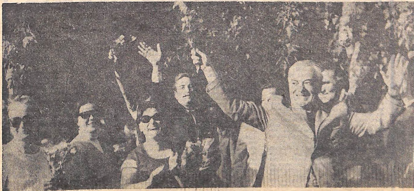
На фото: колектив Київського театру імені Франка в Кіровограді.

Вчора однією з кращих п'єс української радянської драматургії «Ярослав Мудрий» Івана Кочерги розпочалися гастролі прославленого колективу.