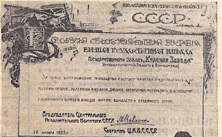
На фото: Грамота з сільськогосподарської виставки, якої удостоєний завод «Червона зірка» в 1923 році.

Тяжку спадщину залишила війна й на колишньому заводі Ельворті, що в 1922 році дістав назву «Червона зірка». Цехи мовчали, під дахами корпусів безпечно гніздилися горобці, пуставала заводська рампа.