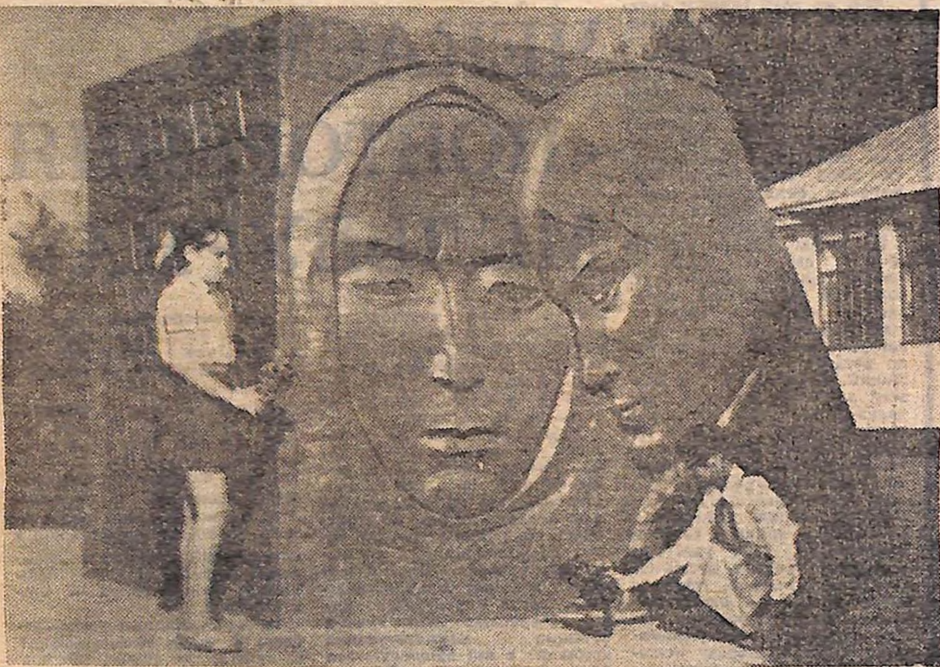
СЕЛО ЛОЗУВАТЕ УЛ'ЯНОВСЬКОГО РАЙОНУ. ОБЕЛИСК ВОЙНАМ-ЗЕМЛЯКАМ, ЯКІ ЗАГІНУЛИ В БОЯХ З НІМЕЦЬКО-ФАШИСТСЬКИМИ ЗАГАРБНИКАМИ.