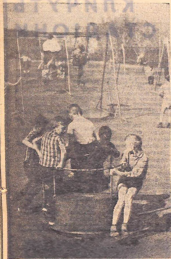
Дендропарк Весело і цікаво відпочивають діти на майданчику, який обладнано спеціально для них.