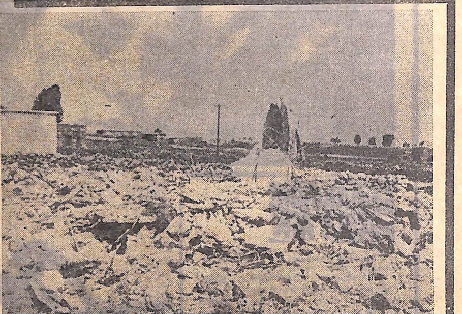
Ізраїльська воєнщина продовжує агресивні дії на території Лівану та Сирії. В результаті нальотів авіації, обстрілів гинуть мирні жителі — діти, жінки, старики.

Немає ніякого сумніву в тому, що, стоячи на шляху взаємовигідного ділового співробітництва з нашою країною, американські керівники враху-