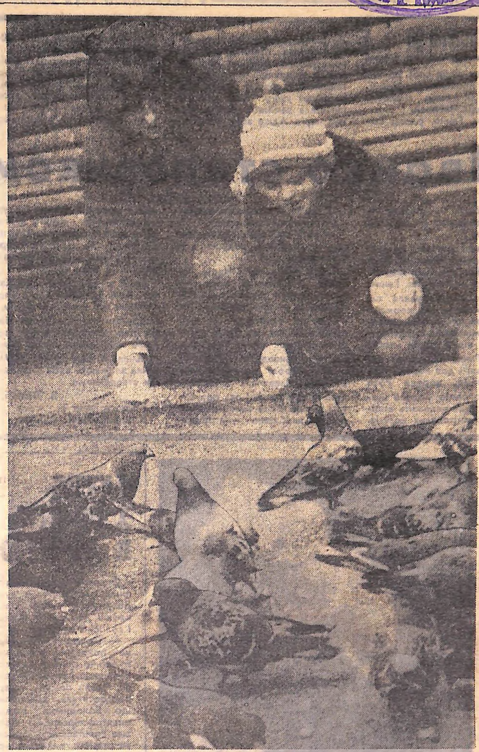
ЗУСТРІЧ НА ПЛОЩІ.