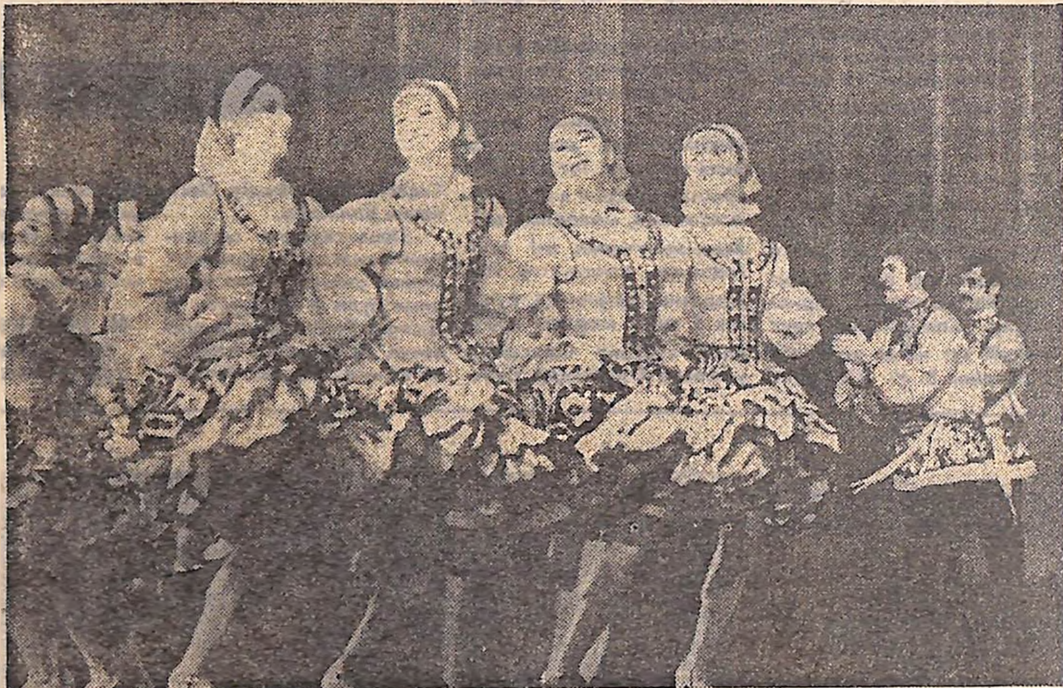
На знімку: виступ Молдавської танцювальної ансамблю «Жок».