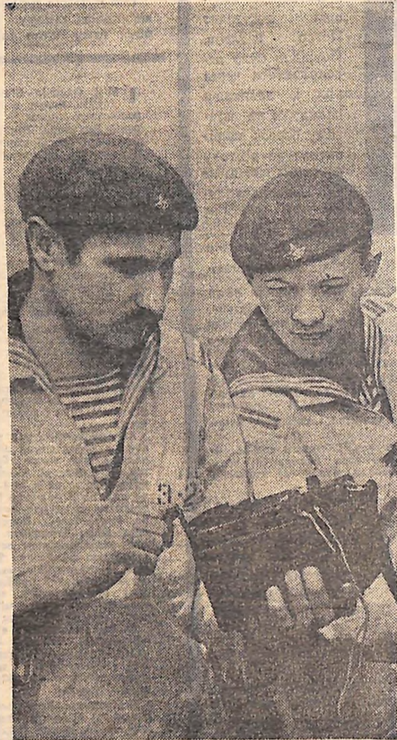
ЧЕРВОНОПРАПОРНИЙ ЧОРНОМОРСЬКИЙ ФЛОТ.

За роки війни чимало довелось зробити бойових походів підводникам. Із Новоросійська «Щука» доставляла оточеним в Севастополі радянським військам боєприпаси, продовольство, медикаменти, пальне, а звідти підводники вивозили на Велику землю поранених. Відважні моряки блокували береги Румунії та