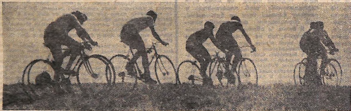
ЦІ РІВНІ І КРУТІ СТЕЖКИ...