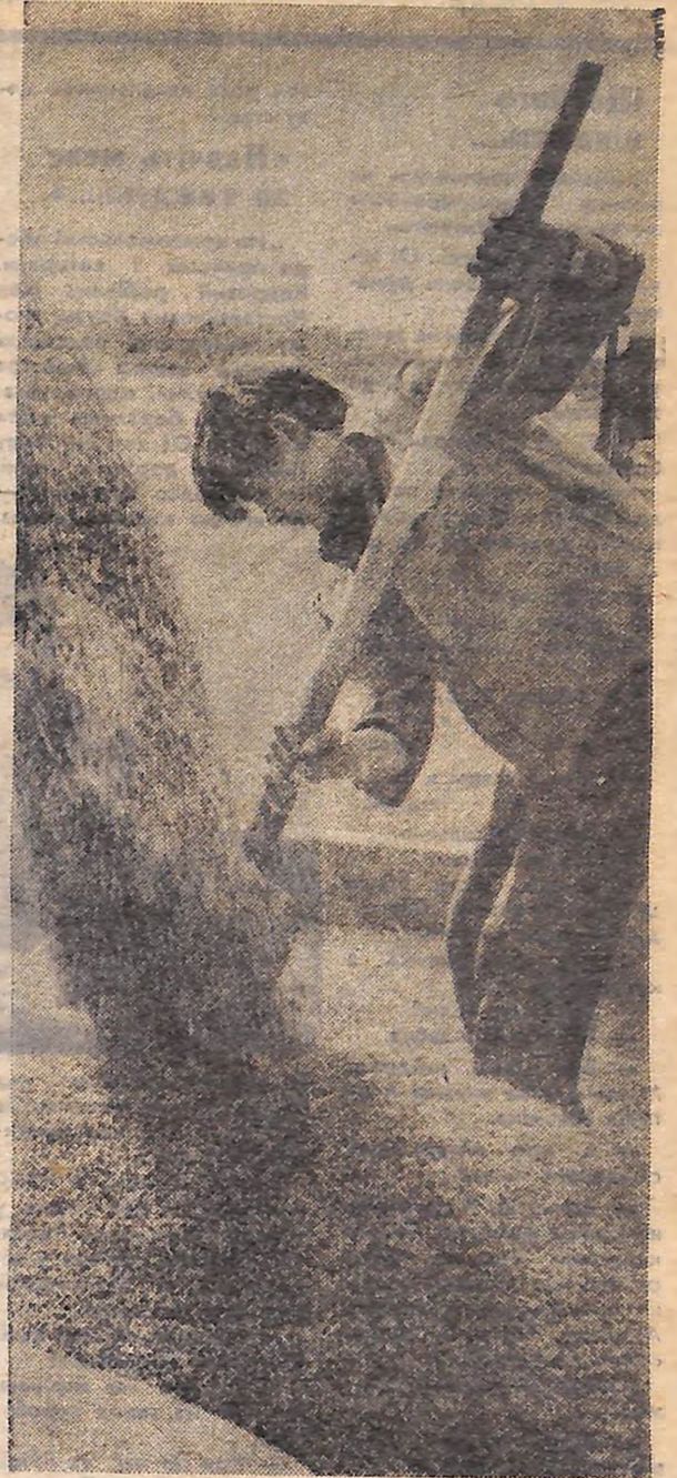
ІДЕ ЗЕРНО ВРОЖАЙНИХ ПІВ КІРОВОГРАДЩИНИ.