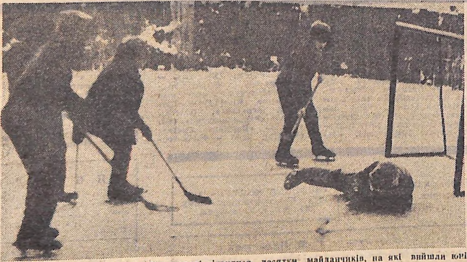
З перших зимових днів в Кіровограді з'явилися десятки майданчиків, на які вийшли юні хокеїсти.