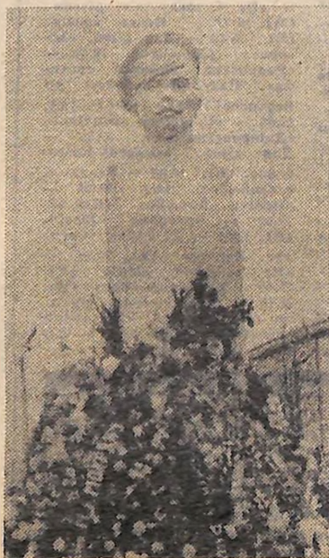
Пам'ятник М. І. МОКРЯКУ.