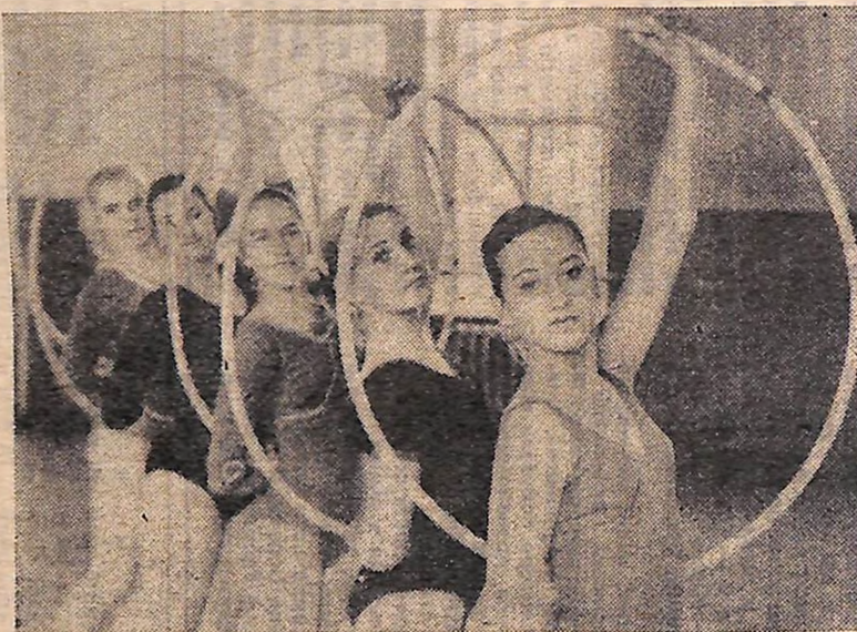
Студентки факультету фізичного виховання Кіровоградського педінституту, які тренуються в секції художньої гімнастики — найбільшій в області, вони не раз виходили в число призерів, виступаючи на республіканських змаганнях.