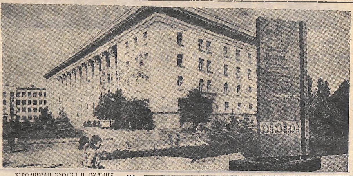
КІРОВОГРАД СЬОГОДНІ. БУЛІЦЯ КАРЛА МАРКСА НА ПЕРЕДЬОМУ ПЛАНІ — ЛЕНІНСЬКИЙ ПОСТАМЕНТ ШАНІ.

Б. КУМАНСЬКИЙ, спецкор «Молодого комунара». м. Новоархангельськ.