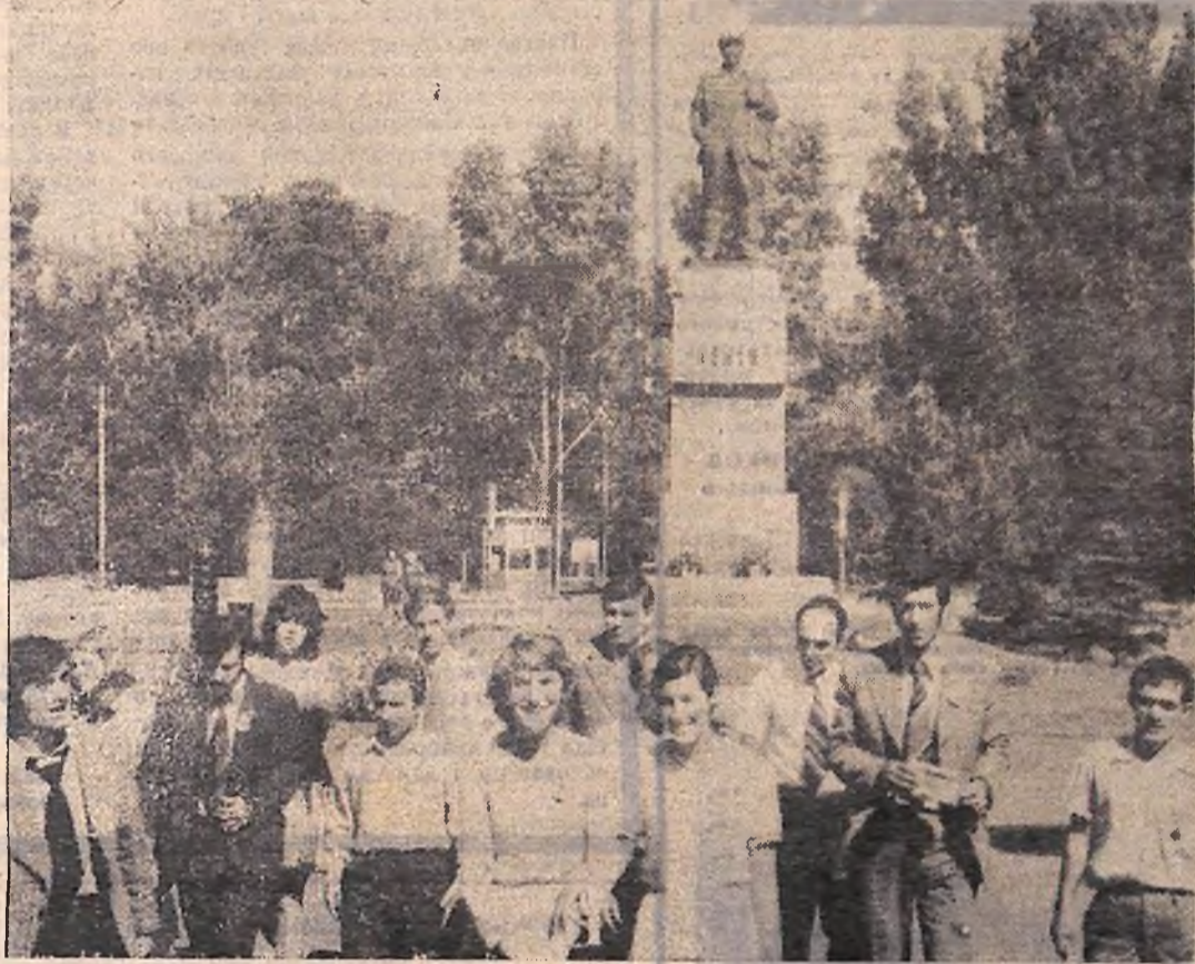
Наші гості — молодіжна делегація з толбухінського округу.

Під час перебування на Кіровоградщині делегація болгарської молоді відвідає Знаменське локомотивне депо, підприємства гірничої Олександрії. В ці ж дні відбудеться вечір радянсько-болгарської дружби.