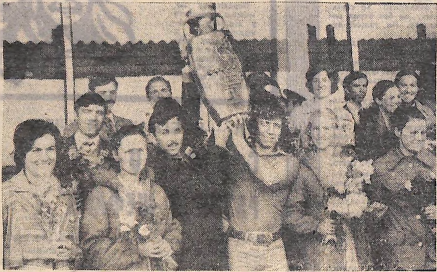
На знімку: учасники ансамблю Кіровоградському аеропорту.

Повернувся з Польщі самодіяльний народний ансамбль пісні і танцю «Весна» Кіровоградського Палацу культури імені Компанійця. Як ми вже повідомляли, його учасники брали участь у міжнародному фестивалі фольклорних ансамблів, що проходив у місті Зелена Гура, та святкуванні 30-річчя газети «Трибуна люду». Кіровоградці зуміли донести до польських глядачів чарівність українського народного мистецтва. Свідчення цьому — призи, грамоти, сувеніри, а найголовніше щира прихильність, яку постійно зустрічали наші земляки у багатьох вояводах братньої Польщі.