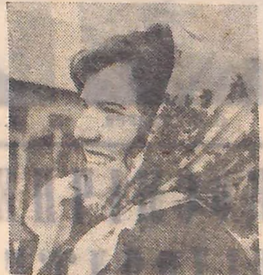
На фото: О. КОЗАЧЕНКО.

Валентина Гугіна — радгосп цукрокомбінату Олександрійського району — 359.