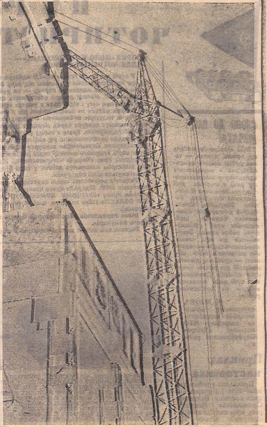
На фото: монтажник Микола ПРОКОПОВ (зліва); праворуч — будівництво Куцівського елеватора.

УСПІШНИМИ темпами йде будівництво куцівського елеватора, що в Новгородківському районі — республіканській комсомольській будові. Будівельники пересувної механізованої колони № 139 тресту «Південелеваторбуд» зобов'язались до початку жнив завершити будівництво елеватора потужністю в 78 тисяч тонн зерна.