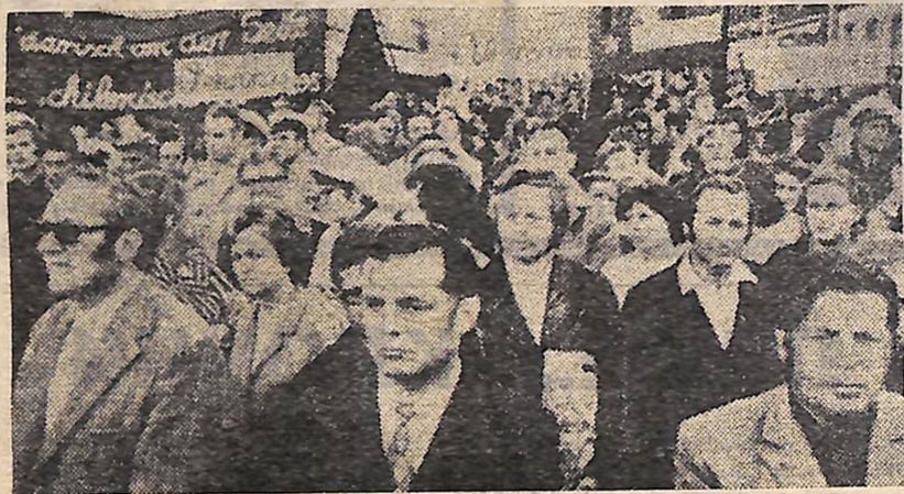
Мітинг солідарності з народом Чилі на одному з підприємств Гамбурга.

КАН-ХОСЕ (ТАРС). Тисячі робітників, селян і студентів зібралися на одному з спортивних стадіонів столиці Коста-Ріки на урочисте закриття міжнародного фестивалю політичної пісні — «Пісня для Чилі».