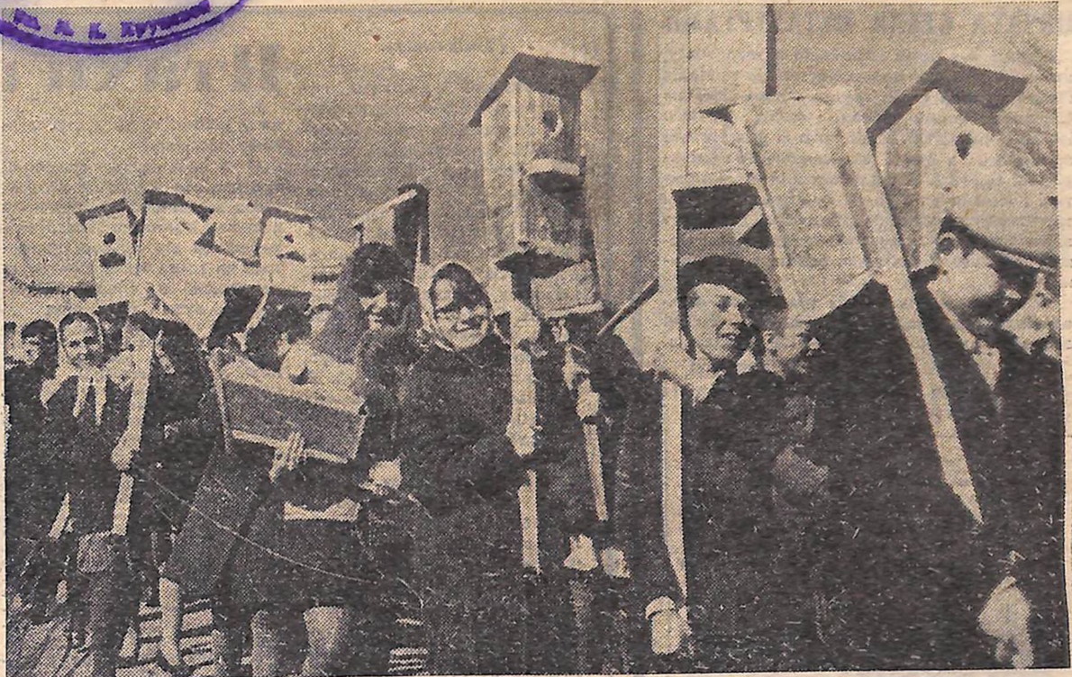
НОВІ ДАРУНКИ ПЕРНАТИМ. ДЕНЬ ЗУСТРІЧІ ПТАХІВ У НОВГОРОДКІВСЬКІЙ СЕРЕДНІЙ ШКОЛІ № 2.

(Розповідь про шкільну виробничу бригаду Новгородківської середньої школи № 2 читайте на 2-й стор.)