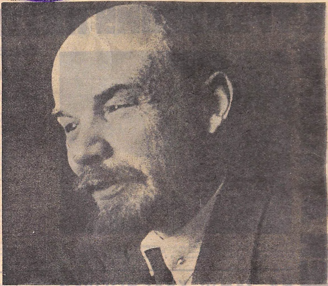
В. І. ЛЕНІН.

Сьогодні— 105-та річниця з дня народження Володимира Ілліча Леніна