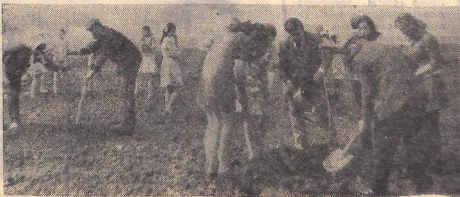
На фото: незабаром тут зашумить молодий парк.