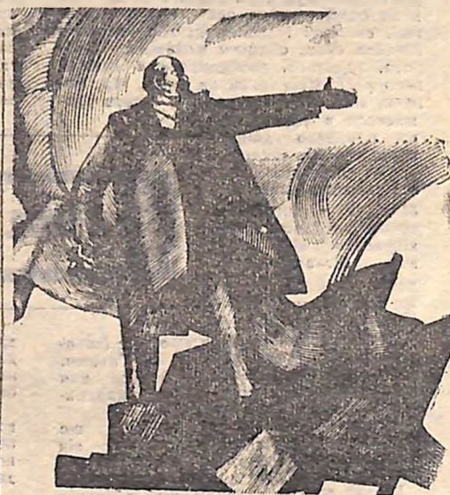
Швейцарці свято шанують пам'ять про В. І. Леніна, знають і обірають ленінські місця. Тому з інтересом тут зустріли і замітку Самуеля Круппа в газеті «Базлер нахріхтен».

приїжджав у Базель, щоб виступити з доповіддю про «Військовий стан і майбутнє Росії» на зборах студентів і російських робітників-емігрантів. Збори були організовані гуртком «Російська академічна молодь» при Базельському університеті. Цей виступ відбувся ввечері, в приміщенні, яке належало одному з робітників спілки кафе Іоганні Тергейм. Володимир Ілліч говорив про становище в Росії, про війну в Європі, яка неперервно має привести до революції і скінчення царизму. Перш за все, вказував Володимир Ілліч, необхідно скинути царя і тих, хто його підтримує — капіталістів і поміщиків, а потім уже можна буде говорити про майбутнє Росії. В Базелі В. І. Ленін зустрівся на Гольбейнштрассе, 22. Перед своїм поверненням у Берн він провів кілька годин у залах великої художньої галереї Базеля перед полотнами Гольбейна і Бекліпа.