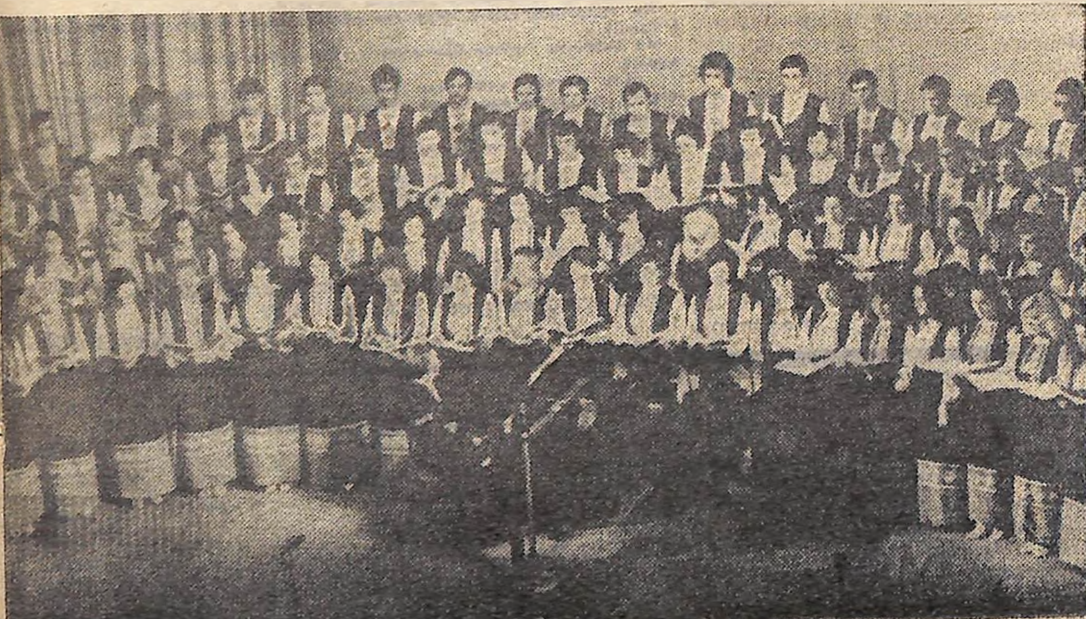
Виступає хор музично-педагогічного факультету педінституту.

Гандболістки збірної Кіровоградщини, які беруть участь у фінальних змаганнях VI літньої Спартакіади УРСР, зустрілися в першому матчі з спортсменами м. Ровно. Цей напружений поєдинок проходив при явній перевазі наших землячок і закінчився перемогою кіровоградок з рахунком 18:10.